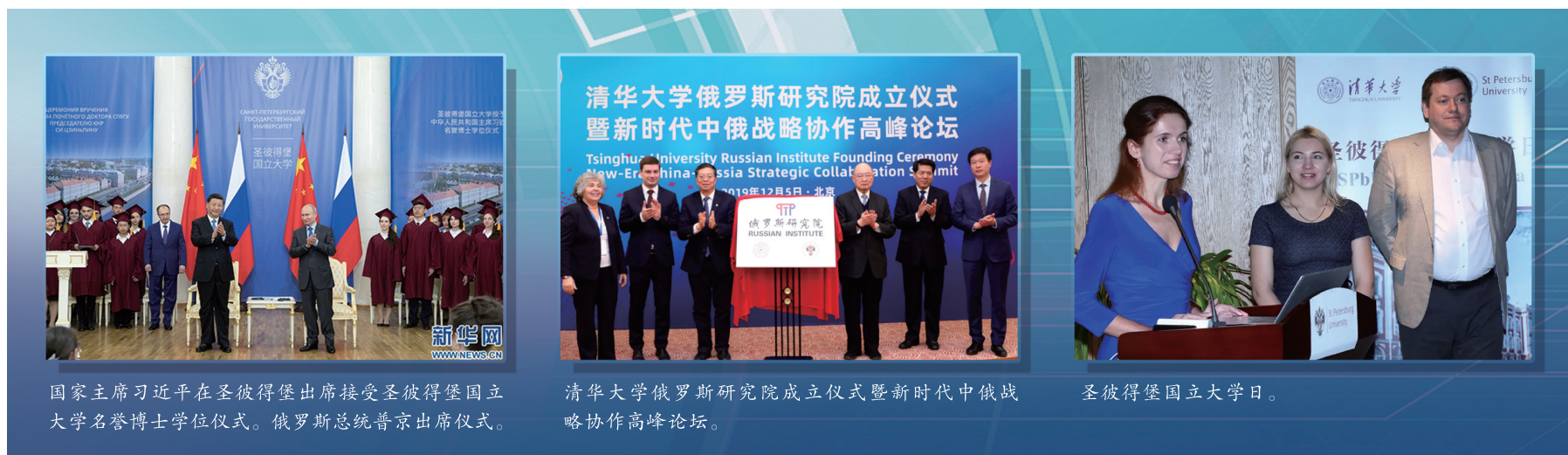
国家主席习近平在圣彼得堡出席接受圣彼得堡国立大学名誉博士学位仪式。俄罗斯总统普京出席仪式。