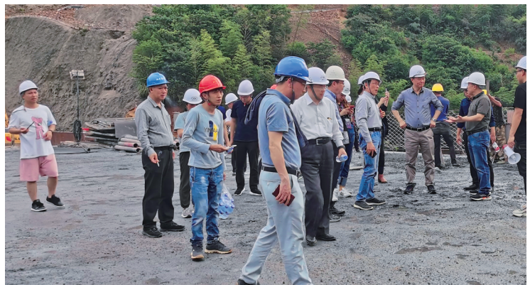
现场考察坪坑堆石混凝土高坝建设情况。

本报讯 5月6日-9日,堆石混凝土高坝建设关键技术研讨会暨“十三五”国家重点研发计划《新型胶结颗粒料坝建设关键技术》项目成果总结咨询会在福建省龙岩市召开。会议由清华大学主办,水利部原总工程师汪洪、中国水力发电学会副秘书长陈东平、中国水利水电科学研究院副总工程师张国新、中国大坝工程学会副秘书长郑瑞莹,以及水利水电规划设计总院、水电水利规划设计总院、江河水利水电咨询中心、华东勘测设计研究