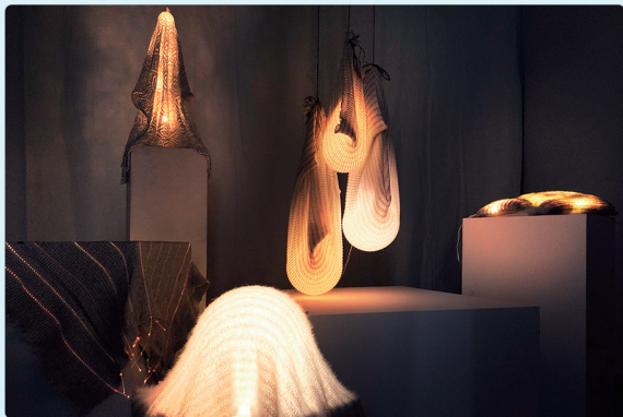
孟轩竹《ClothLight - 一种基于电子 织物材料的交互装置设计》 指导教师:吴琼