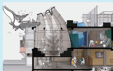
于琦《国祥胡同6号院改造项目》 指导教师:崔笑声