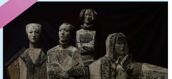
吴丽云《巾帼芳华》 指导教师:陈辉