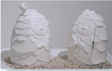
邱广宁《M-U-P》 指导教师:尹航