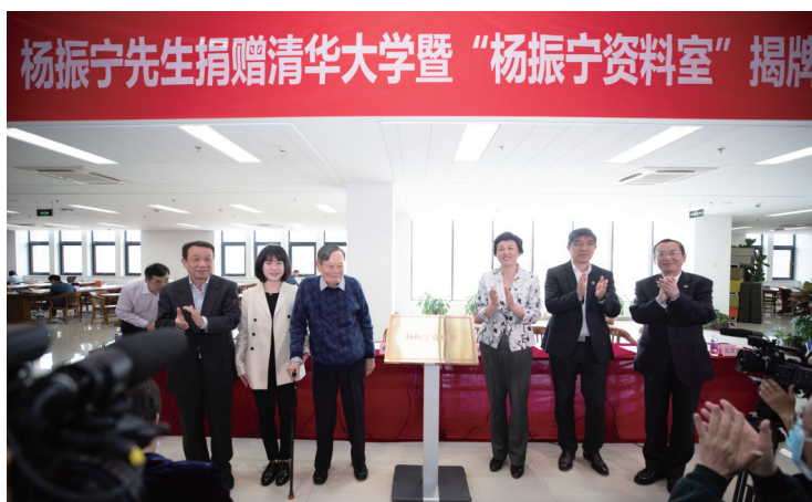
为“杨振宁资料室”揭牌。