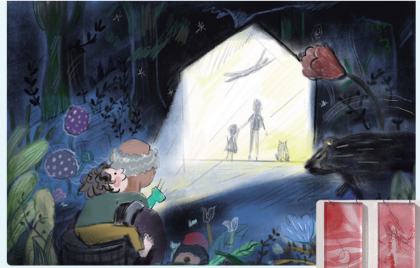
马晓君《我和我的爷爷》 指导教师:包林