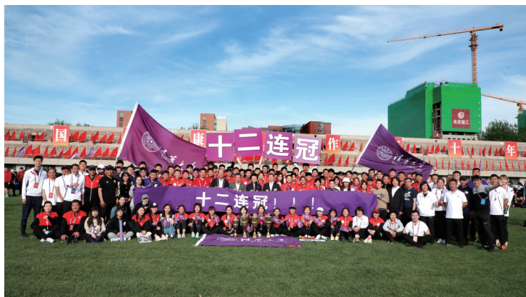
清华田径队夺得“十二连冠”。