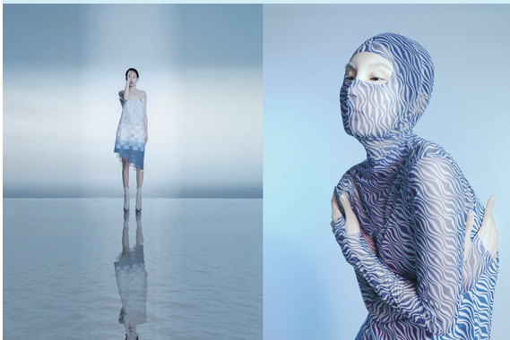
李春晖《内境》 指导教师:王悦