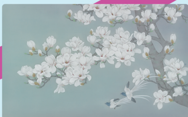
黄钰婷《花序》之一 指导教师:金纳