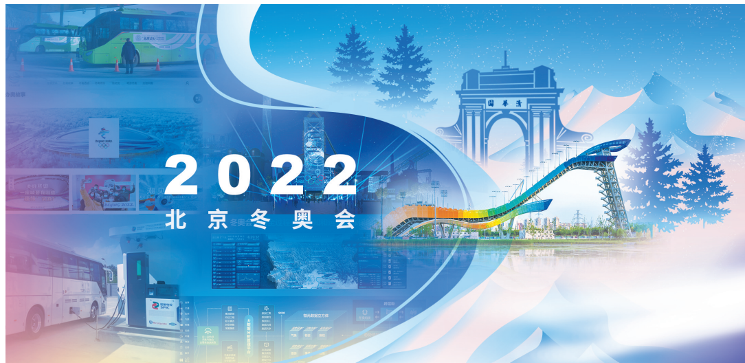
清华大学作为参与“科技冬奥”项目最多的单位共牵头7个项目,涉及场馆建设、公共安全保障、全球传播技术、新能源汽车、疫情防控等多个关键技术,共同展现出清华在冬奥会中贡献的科技力量。 图片设计/李娜

科技创新成就“智慧冬奥”,肩负使命展现“清华力量”。正是有了大家的辛苦付出,才有了更创新、更智慧、更精彩的北京冬奥会!